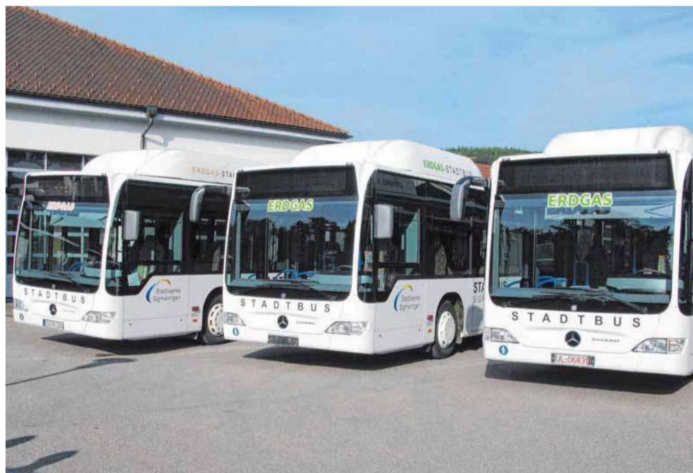
Seit 2009/2010 kommen diese drei Erdgas-Niederflurbusse zum Einsatz.

Etwa 354000 Kilometer werden im Stadtverkehr - Stadt- und Schülerverkehr - jährlich zurückgelegt 29 Sitz- und 32 Stehplätze hat ein Erdgasbus Rund 45 Kilometer lang ist das Liniennetz des Stadtbus Sieben Linien werden gefahren, davon ist die Linie 6 (Laiz) mit 10,2 Kilometern die längste und die Linie 7 (Bahnhof-Karlstraße) mit 2,7 Kilometern die kürzeste Linie Fünf Busfahrer werden zur Beförderung der Passagiere eingesetzt Deutlich geringer ist das Unfallrisiko im Bus als beim PKW