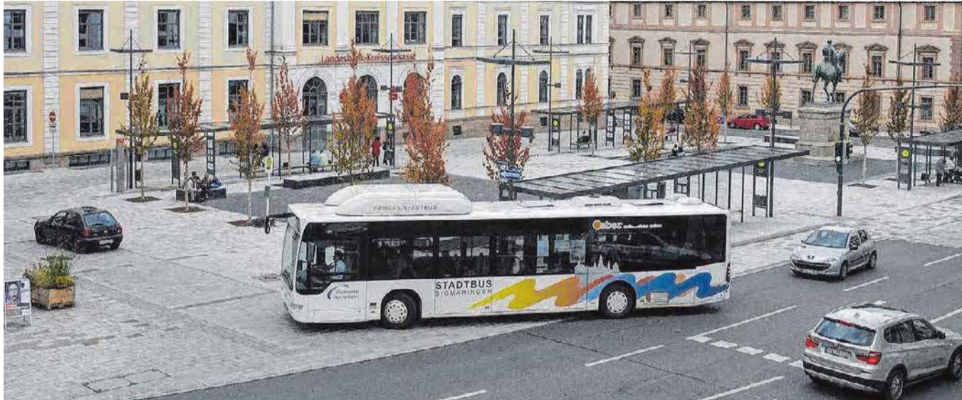
Der Leopoldplatz ist der zentrale Ein- und Umsteigsplatz in Sigmaringen.

Am 15. Februar 1992 fuhr der Stadtbus zum ersten Mal durch das Stadtgebiet Sigmaringens. Nun nach 25 Jahren befördern die Sigmaringer Stadtbusse täglich im Halbstundentakt rund 3000 Fahrgäste auf sieben Linien und sind aus der Stadt nicht mehr wegzudenken. Mit verschiedenen Aktionen und Veranstaltungen wird das Jubiläum von den Stadtwerken Sigmaringen gemeinsam mit den Bürgern gefeiert.